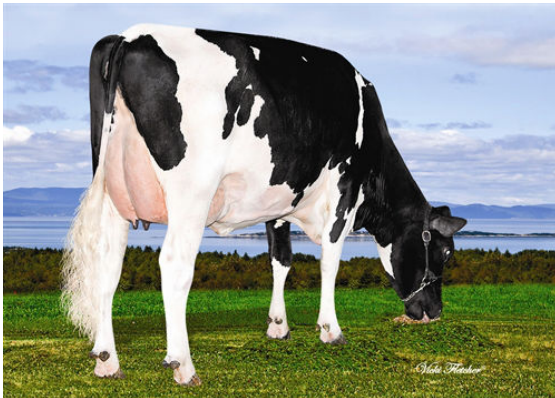
PELLERAT MOGUL SHEILA DAM